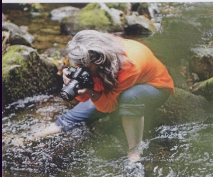
Prise de vue au plus près de Mère Nature.

Une rencontre avec un illustrateur la propulse, un peu par hasard, dans l'univers de la prise de vue. «C'est là que je crée ma première petite entreprise pour facturer mes services», affirmait-elle lors de notre première rencontre en juin 2015. Les choses s'enchaînent à la force de la détermination et de la soif de savoir et surtout de comprendre. Concours, expositions, elles les enchaînent, son savoir-faire se renforce. Elle se trouve et considère «son travail artistique comme un véritable travail.» L'artiste se mue alors petit à petit en entrepreneuse. Avec AurOD, une étape est franchie mais la route est longue. Sur son chemin entrepreneurial, elle décide de prendre certaines traverses pour appréhender cet écosystème qu'elle côtoie aujourd'hui. «2017 aura été une année dense dans mon évolution après certaines périodes de doutes. Il y avait des jours où je n'allais plus faire de prises de vue, l'énergie n'était plus là.» De formation en formation, notamment, via un passage par l'Académie du Luxe à Paris où elle suit l'été dernier une session sur mesure sur la communication et la vente pour artiste, ODE se structure elle-même et peaufine ce qu'elle n'appelle pas business model mais qui y ressemble bien. «Ma formatrice m'a tout de suite cernée. Elle m'a dit d'entrée de jeu «vous avez peur de la réussite». Elle a mis le doigt là où cela fait mal.» Tout en ajoutant : «je crois en vous et j'aime ce que vous faites.» Forces, objectifs,